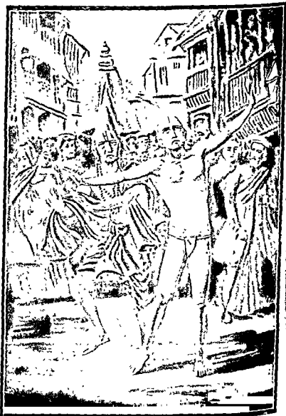
श्रीनितार्ई और हरिदासका नाम-प्रचार